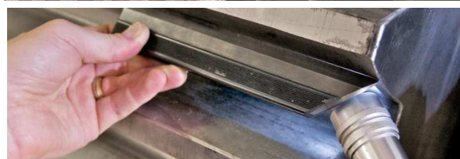
Fig. 1: Medições em redutores planetários com o dispositivo de medição de vibrações Fig. 2: Inspeção de desgaste no flanco de carga de engrenagens de dentes grandes