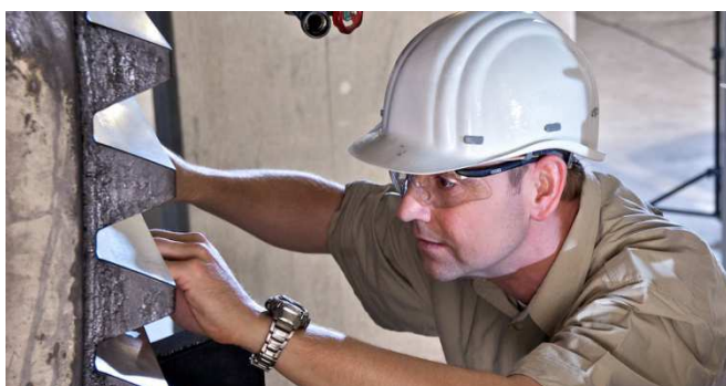
Verificação do "padrão de contato estático" da engrenagem de dentes grandes